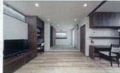
お母様のリビングは、木の温もり漂う明るい空間。和室（奥）のほか、防音設備が整った趣味室も配置