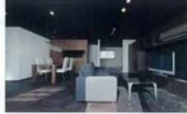
大きなTVボードも同社の造作。大開口からの日差しが心地よく、くつろぎ感にあふれている