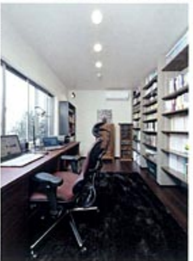
心地よく仕事をするための書斎はアジアンテイストにコーディネート。ここからの眺望も素晴らしい