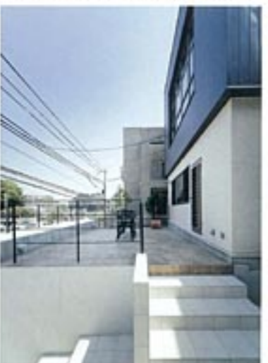
ガレージ上部の、名付けて「チェリービューバルコニー」。キッチンからの最短動線が確保されている