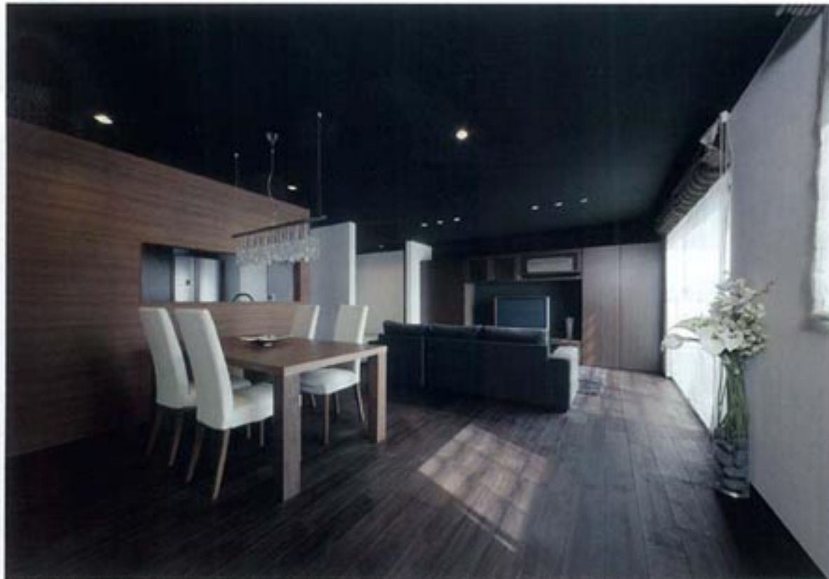
高い天井とダークな床材により、落ち着きを醸し出した子育てのLDK（2階）。生活感の見えない空間づくりを望まれたことから、キッチン造作の壁面により緩やかに仕切り、お洒落な店舗風に仕上げている。外観と調和したシックなデザインが、建築設計事務所ならではの提案力を物語っている