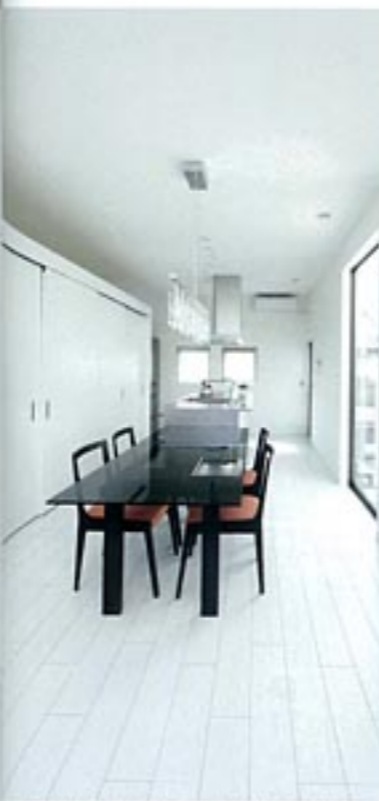
吹き抜けに面したLDK。キッチンとダイニングを一直線に配置し、背面の大収納は希望どおりに造作