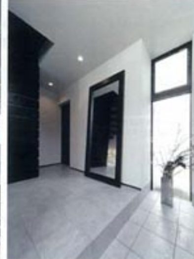
各々の友人が気がおなく出入りできるように玄関も別々。子育ての玄関キールはタイル貼りが爽やかだ