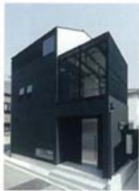
白黒のコントラストが美しい外観。大きなプライベートバルコニーも