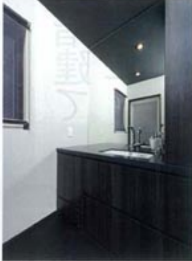
ノーパンインシストによる造作の洗面台。収納スペースを豊富に設け、使い勝手がよい設計に