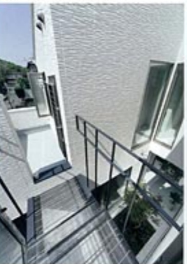
ブリッジを渡って、LDKから洗面・浴室へ。レベル差を活かした空間構成が、住まいを個性的に演出