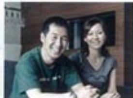
「家族の希望に合わせて、プランを10回も練り直していただきました」