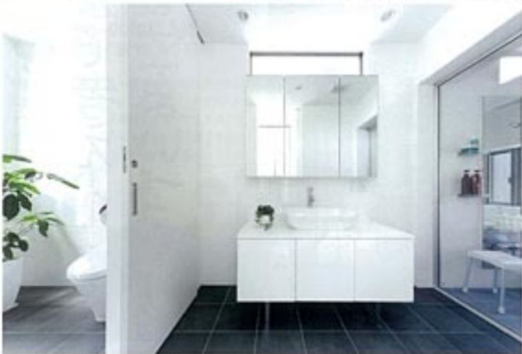
トイレ、洗面、浴室を緩やかにつなぐ空間は、リゾートホテルのよう。LDKとは2WAYで結び、回遊できるプランによって利便性を創出。光に囲まれて暮らしたいという思いは隔々にまで実現されている