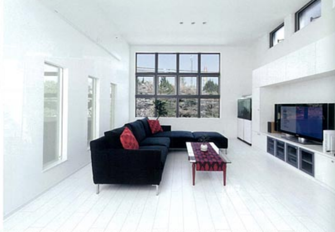
吹き抜け、柱には紅葉を楽しめる空地を活かすプランを考案。天井が高く、採光にも恵まれたリビングにはゆとりが深い。「家に心満たされ、優雅な気分が暮らせるのが嬉しいです」とHさん。このページの写真はすべてH氏邸（敷地面積/135.25㎡、延床面積/130.99㎡、竣工/2009年3月、家族構成/夫婦）