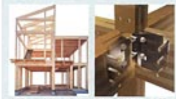
大開口、吹き抜けなど開放的な空間構成が可能 耐震・耐久性、空間の 可変性も併せ持つ

「いいものをつくり、きちんと手入れして長く大切に使う」というストック型社会への移行を背景に、国土交通省が「先導的モデル事業の促進」を公募。優れた提案に対して予算の範囲内で事業の実施に要する費用の一部を補助する「超長期住宅先導的モデル事業」。一級建築士事務所フリーダムは、同事業の「住宅の新築」部門に採択され、2棟を施工。設計事務所としては例を見ない同事業での採択は、同社の住まいが信頼できることの証である。超長期住宅といえ、質実剛健なイメージが強いが、そこにフリーダムらしさを添えていきたいと同社。SE構法のメリットを活かした超長期デザイン住宅に興味をお持ちの方は、お気軽にお問い合わせを（06-6344-8512まで）。