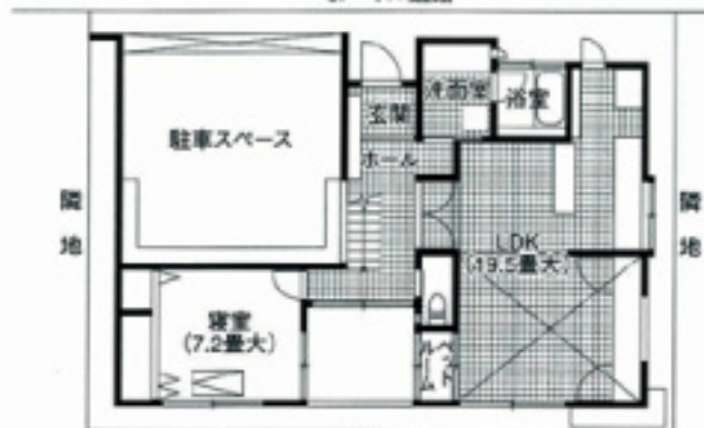
敷地配置・1階平面図 (1:200)

夫婦と両親同居の家。モノトーンを基調にした色使いとタイルな造形デザインの性豊かな住宅です。 家づくりに際しては、夫婦が徹底的に自分たちの好みと使い勝手を追求しました。1階の大半に敷き詰められた大理石タイル、玄関ホールの階段脇から愛車をのぞけるように設けたガラス窓はご主人、ブティック形式で照明プランまで店のスタイルに合わせたウォークインクローゼットは奥様の注文通り。リビングの脇には愛犬のためのペットルームも設けられています。